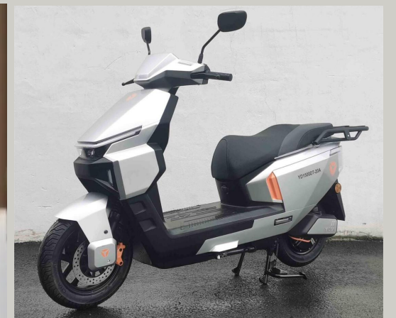
← ↑王家中與雅迪科技的兩輪電動車。

參考消息網5月21日報導，英國《金融時報》網站5月17日報導，伊朗戰爭引發的油價飆升，令中國兩輪電動車製造商迎來發展良機。全球最大的兩輪電動車生產商之一中國雅迪科技集團有限公司在東南亞和南美市場銷量激增。該公司今年海外銷售額預計同比增長約70%。